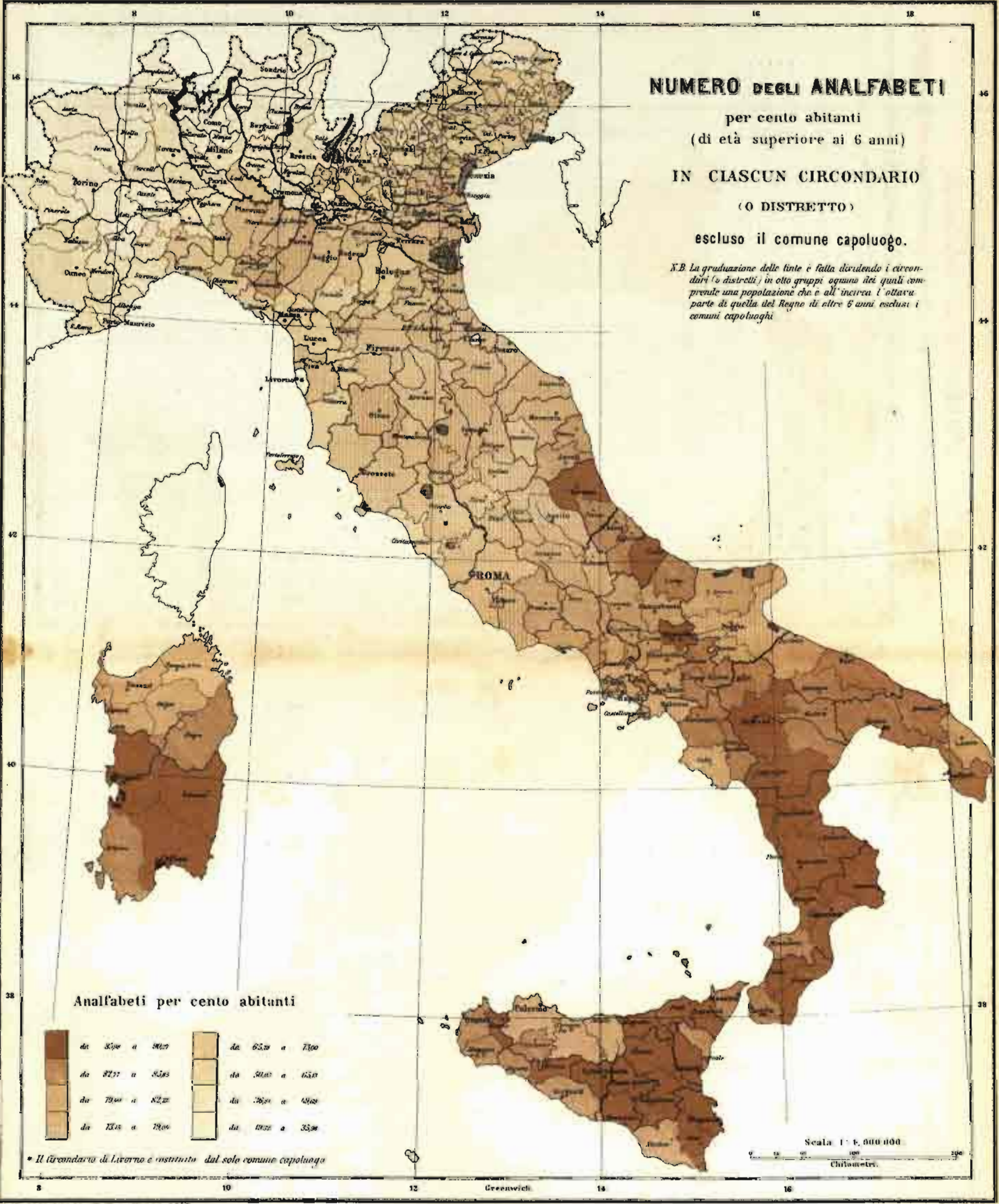
Analfabeti per cento abitanti

N.B. La graduazione delle tinte è fatta dividendo i circondari (o distretti) in otto gruppi ognuno dei quali comprende una popolazione che è all'incirca l'ottava parte di quella del Regno di oltre 6 anni esclusi i comuni capoluoghi