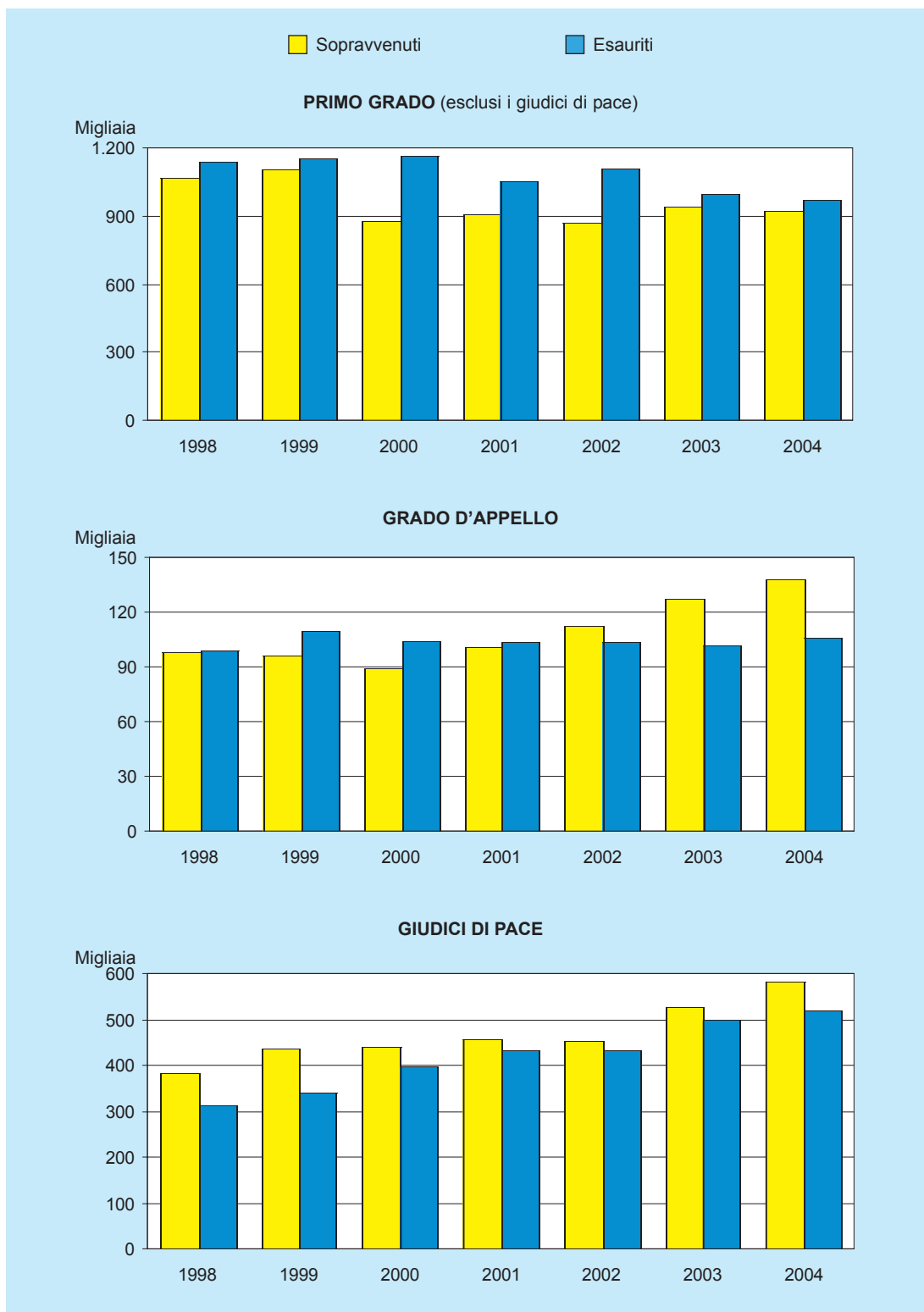
Figura n. 1 - Procedimenti civili di cognizione in complesso