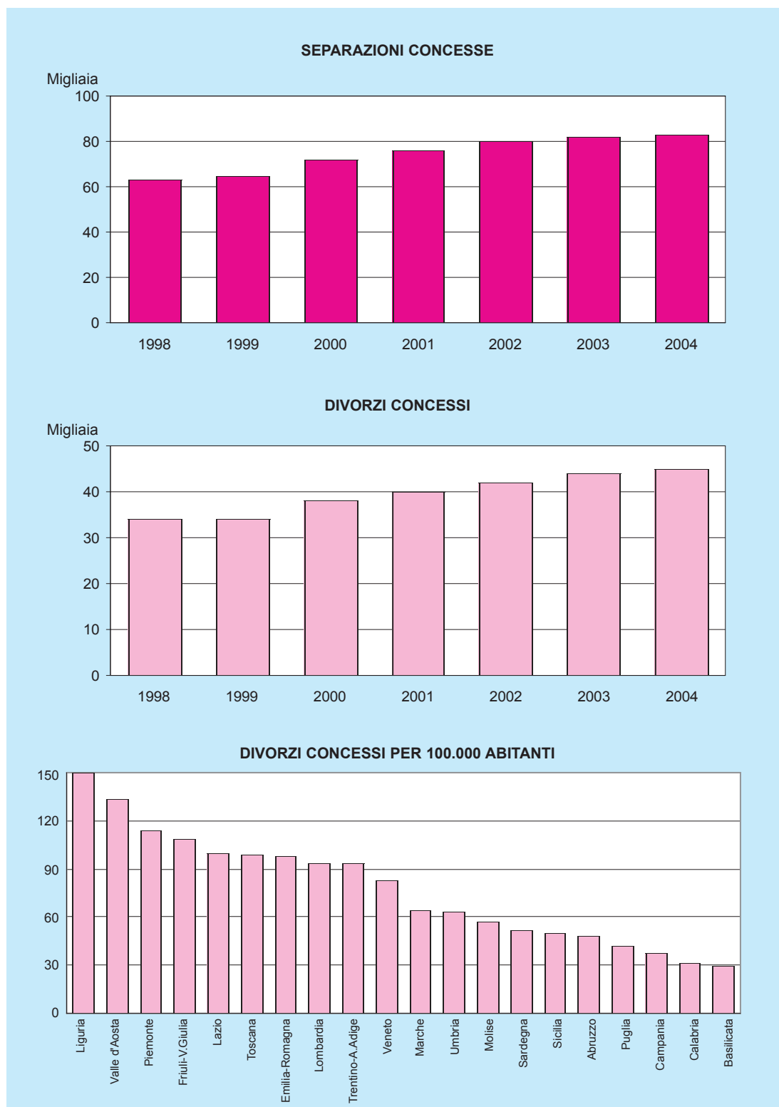
Figura n. 2 - Separazioni e divorzi concessi, divorzi concessi per regione (per 100.000 abitanti)